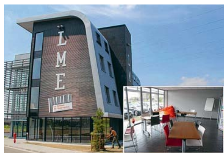
Le CoWork Factory s'est installé à la Maison de l'Entreprise. ■ D.C.

« C'est la deuxième fois que je participe aux animations proposées par le CoWork Factory. Je suis actuellement en train de chercher un concept novateur. La formation sur l'Empathy map va m'aider à mieux cibler ma future clientèle. »